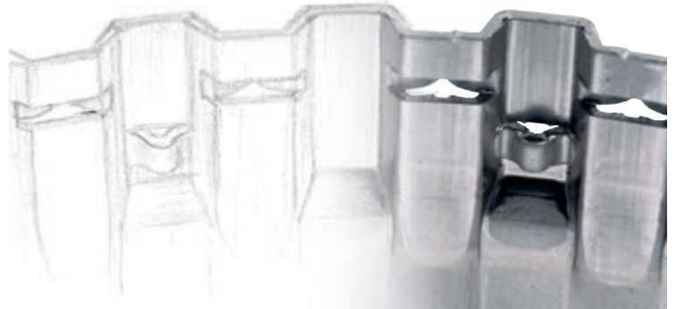
스케치 초안부터 완제품까지